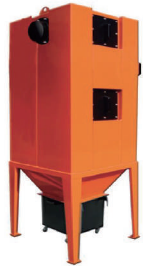
除塵装置サイクロン